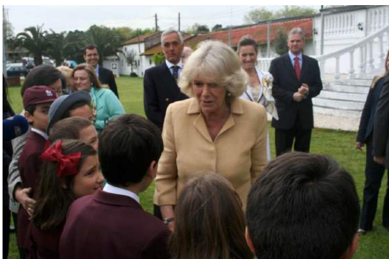
A Queen Elizabeth's School foi convidada pela Embaixada Britânica, no âmbito da visita de Estado de Suas Altezas Reais, o Príncipe de Gales e a Duquesa da Cornualha, a levar os seus alunos finalistas a assistir a uma apresentação do cavalo Lusitano na Sociedade Hípica Portuguesa, no dia 29 de Março de 2011.