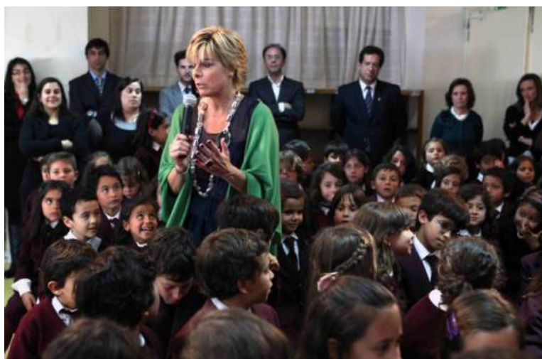
Visita de SAR a Princesa Laurentien van Oranje, no dia 2 de maio de 2012, para a realização de um workshop sobre o livro da Sua autoria "Mr. Finney e o Mundo de Pernas para o Ar".