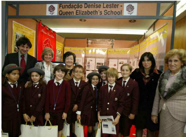
11 a 14 de janeiro de 2007 Realizou-se o 9º Encontro Nacional de Fundações, o qual teve como tema de fundo as "Fundações: Ética e Cidadania", que contou com o apoio da Comissão Europeia, no âmbito do programa de "Promoção da Cidadania Europeia Ativa".

membrance - Poppy Appeal ; a celebração do Ano Extraordinário Jubilar da Misericórdia, um Ano Santo que foi proclamado, no Vaticano, pelo Papa Francisco e teve início no dia 8 de dezembro, dia da Imaculada Conceição e que se prolongará até dia 20 de novembro de 2016, com a Solenidade de Nosso Senhor Jesus Cristo; os 800 anos da assinatura da Magna Carta, que remonta a 1215, cuja digressão mundial passou por sete países, tendo sido Portugal contemplado, atendendo à importância da aliança Luso-Britânica, a mais antiga aliança do mundo e o St. George's Day .