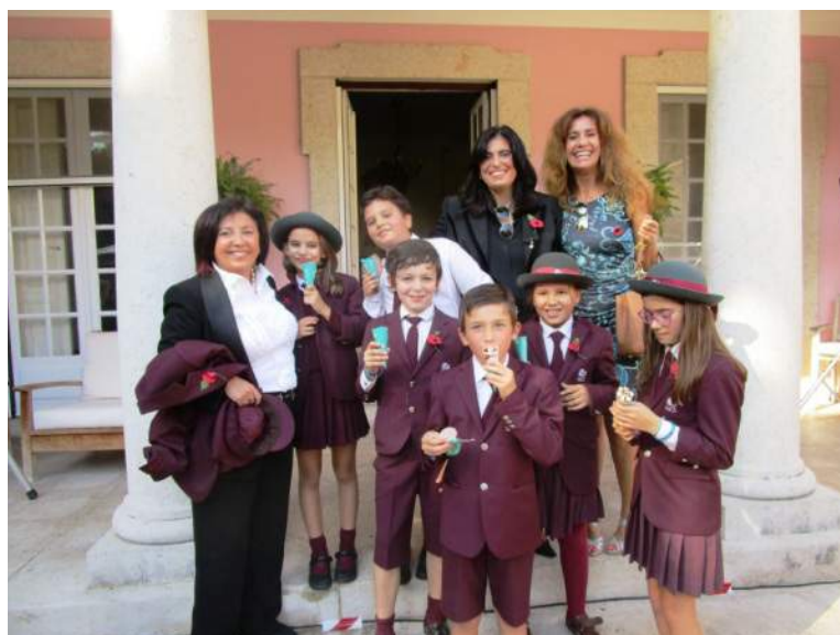
Remembrance Sunday, Lisboa, 8 de novembro de 2015