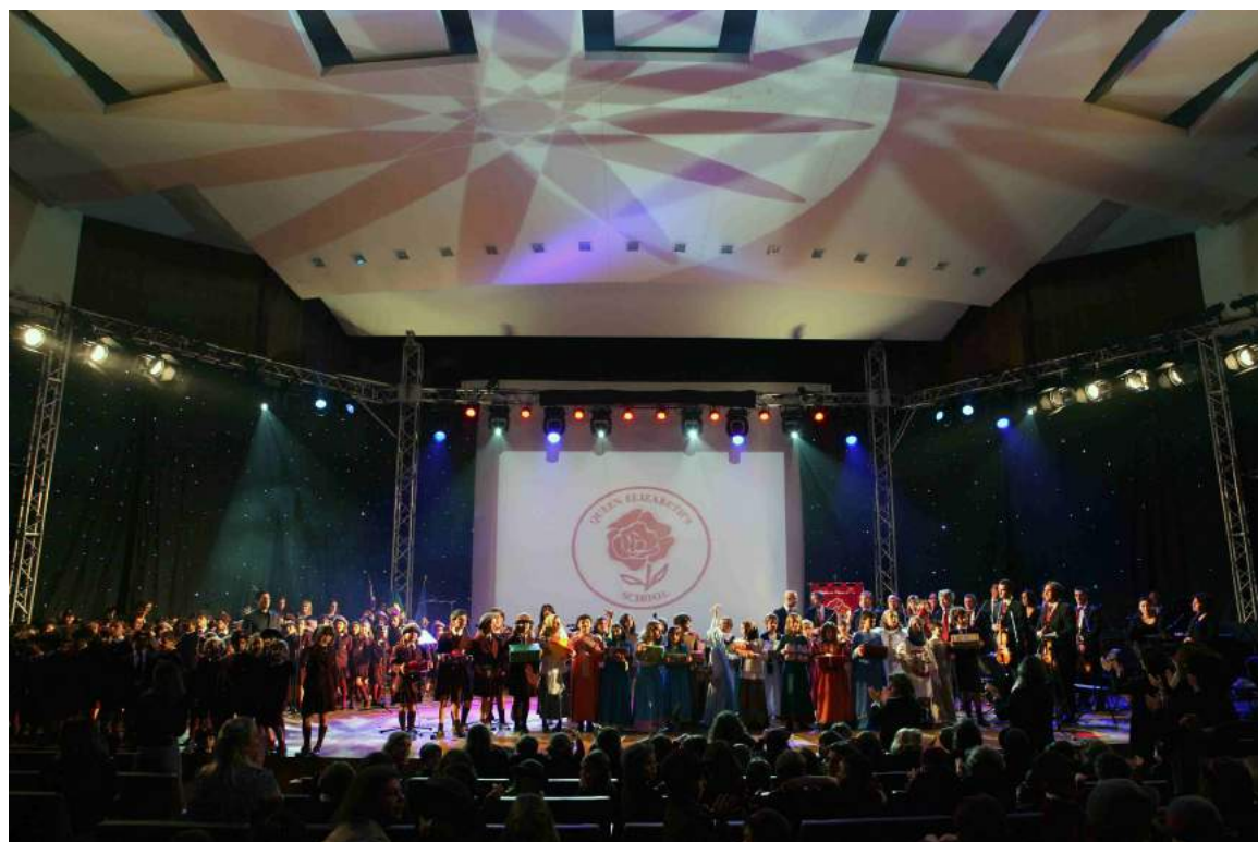
Gala dos 75 anos